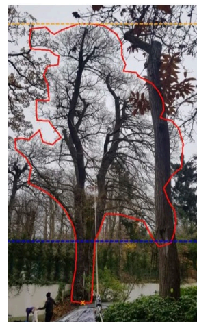
Chêne – 1 er sens de traction

Un élagage est préventif et permet de réaliser des coupes de branches mortes qui, ainsi, ne casseront pas en période de grands vents.